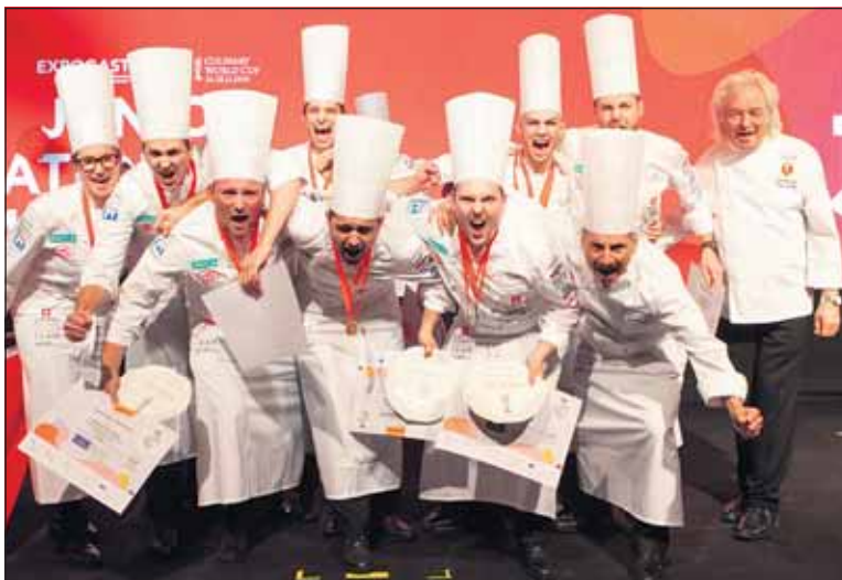
Soeben zum Vize-Weltmeister 2018 erkoren worden.