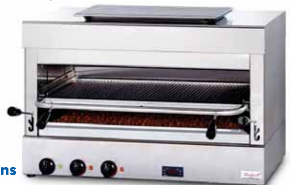
Big BeefGrill mit über 800 °C Leistung

Im Riet 7, 8308 Illnau / ZH, T: 052 346 24 27 info@gamatech.ch, www.gamatech.ch