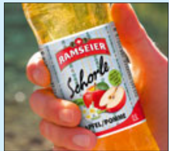
Edelweiss Schorle S. 14