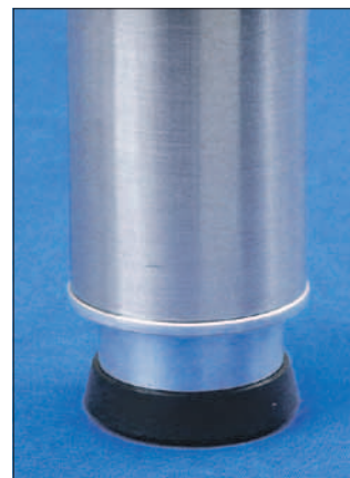
Tischfuss versenkt eingebaut.

Für die optimale Lösung stehen verschiedene NIVELER Modellvarianten zur Verfügung, wie z.B. das Modell Standard „Stärke 2“ für schwere Tische ab ca. 20 kg. Ferner besteht die Möglichkeit für den versenkten Einbau der NIVELER im Holz oder Stahlrohr. Für diese Anwendung sind Schreiner- oder Schlosserei-Betriebe bestens vorbereitet.